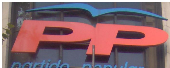
Logotipo del Partido Popular. Tomado de Wikimedia Commons. Autor: Juan (sic)

Su presencia en el poder abarcó dos mandatos, de 1996 a 2000 y de 2000 a 2004. El primero de ellos se caracterizó por una política de consenso, centrista y dialogante, con todos los grupos políticos y con los sindicatos. Esta moderación y actitud dialogante y pactista, confirmó a la derecha como una alternativa válida y democrática, rompiendo el estigma de herencia franquista que pesaba sobre ella.