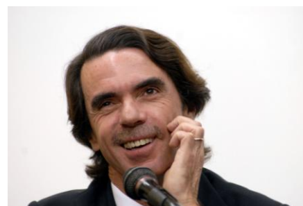
Jose María Aznar.

En 1996 el Partido Popular asciende al gobierno como consecuencia del enorme desgaste del PSOE en el gobierno tras tantos años en el poder y los problemas de corrupción. El PP se había presentado ante la sociedad como un partido de centro, siendo liderado por José María Aznar, abanderando la lucha contra la corrupción. Su victoria electoral no fue excesivamente holgada y debió pactar con los partidos nacionalistas, a fin de contar con un apoyo suficiente para llevar a cabo su proyecto político.