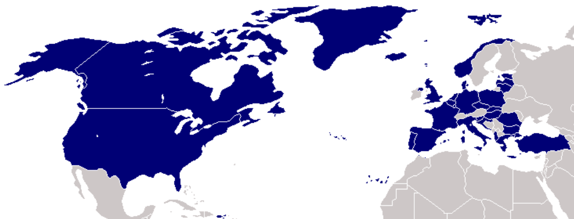
Países miembros de la OTAN.

El intento de integrar a España en los organismos internacionales dio como resultado la entrada de España en la CEE el 12 de Junio de 1985, y la entrada de España en la OTAN 7 , a la que el PSOE se había opuesto mientras estaba en la oposición, habiendo prometido en su programa electoral la realización de un referéndum para que el pueblo decidiese sobre la permanencia o no en la OTAN, en el cual se decidió, por un estrecho margen la permanencia en dicha organización.