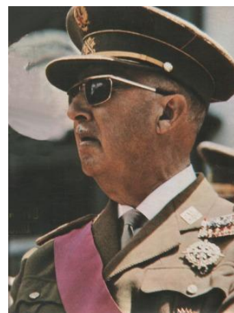
Francisco Franco.

Con el nombre de Transición se conoce el proceso por el que, en España, se restauran las instituciones democráticas que fueron suprimidas tras el levantamiento militar, origen de la Guerra Civil Española, que desembocó en la Dictadura Franquista. Su origen inmediato se encuentra en la muerte del dictador Franco y el nombramiento de Juan Carlos I como su sucesor al frente del Estado. En general se considera que la Transición termina en el año 1982, con la llegada del PSOE al poder, siendo el quinquenio de 1975 a 1979, el de edificación y construcción del estado democrático.