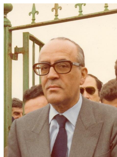
Leopoldo Calvo Sotelo.

Pero, la difícil situación económica del país, así como la dura oposición que realizaba el PSOE, hicieron que la UCD entrase en decadencia, motivado además por la profunda división interna en el partido. Esto hizo que Adolfo Suárez presentase la dimisión, proponiéndose a Leopoldo Calvo Sotelo, también de la UCD, como nuevo presidente. Este momento fue aprovechado por un grupo de militares descontentos, para llevar a cabo una intentona golpista el 23 de Febrero de 1981, cuya cabeza visible fue Antonio Tejero. Tejero entró con sus tropas en el Congreso