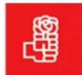
Logo del PSOE. Imagen libre de derechos

1982, 1986, 1989 y 1993, permaneciendo en el gobierno hasta 1996. En las dos primeras elecciones dispuso de mayoría absoluta, mientras que en las siguientes hubo de pactar con otras fuerzas políticas.