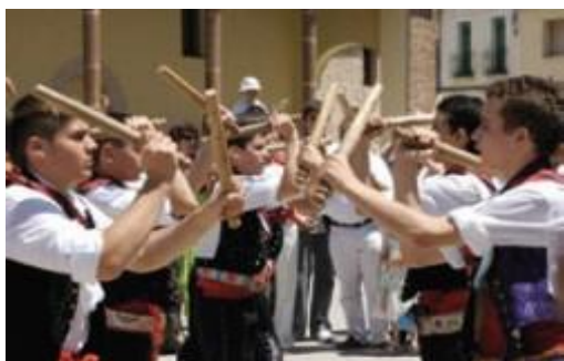
Danza de palos, en la Octava del Corpus de Fuentepelayo (13)