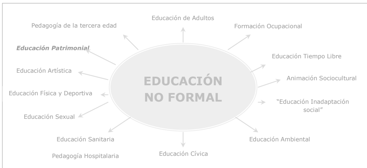
Imagen 1: La educación no formal (elaborado a partir de Trilla, 2003)

ofrece. Recursos y programas que integran parte de lo que conocemos como educación no formal 2 .