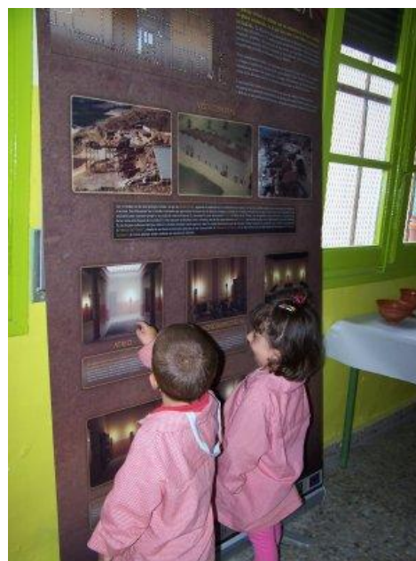
Paneles expositivos “Bílbilis en tu clase”

Con toda la información, libros, enciclopedias, videos o juegos que trajeron creamos el rincón del proyecto, dónde ubicamos todo lo que los alumnos traían de casa y lo podrían utilizar en nuestros momentos de lectura individual o para las investigaciones que realizábamos. Cada día dedicábamos alrededor de 30 minutos a profundizar sobre el tema y resolver las preguntas que nos hacíamos, así como a realizar alguna ficha que afianzara los contenidos trabajados.