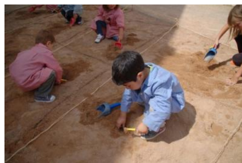
Excavación en el arenero

Una vez de vuelta al colegio realizamos en el arenero del patio del colegio nuestra propia excavación arqueológica. A través de Internet buscamos información de cómo se realizaba una excavación arqueológica y las herramientas necesarias. Después delimitamos el yacimiento, realizamos una cuadrícula para facilitar la excavación y provistos de palas, carretillos y pinceles conseguimos encontrar vasijas, presuntamente de época romana, que allí se encontraban.