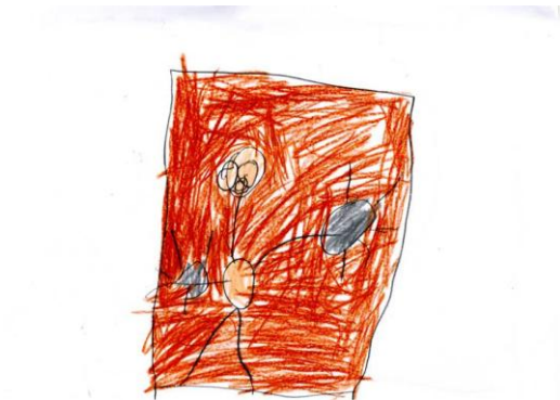
Jacobo excavando, pero no se acuerda delo que excavó