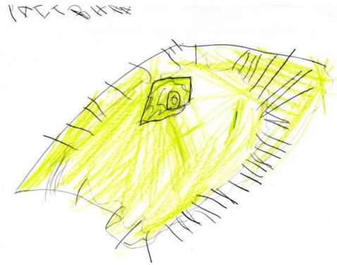
Un teatro que han excavado los arqueólogos