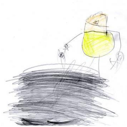
Manu en el arenero excavando con una pala