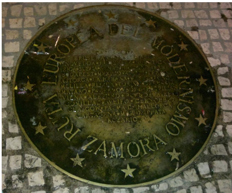
Imagen 2: Placa conmemorativa de la inclusión de Zamora en la Ruta Europea del Modernismo.

Junto al patrimonio modernista de Ferriol cuyas obras contienen elementos propios del modernismo catalán, destacan otros edificios que están adornados con detalles del modernismo internacional como la decoración vegetal, la ornamentación detallista o el uso de las líneas curvas, y de la secession como los péndulos, las formas geométricas (círculos o cuadrados) o los discos.