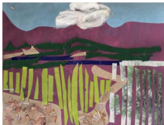
Figura 2. Trabajos realizados por los participantes.