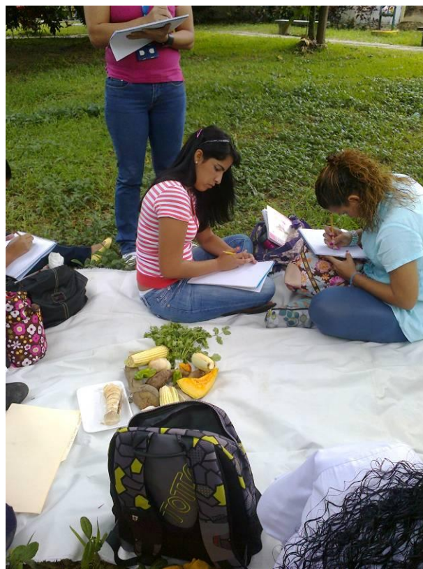
Figura 1. Participantes de la experiencia de Educación Patrimonial.

conocimiento: Pedagogía, Lenguaje, Matemática y Ciencias Naturales.