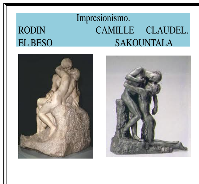
Fig nº 3. Material confeccionado por la autora

escultora y su obra y claramente nos obliga a comentar toda suerte de sentimientos que despiertan estas obras en nosotros como espectadores y también como estudiosos de la materia de Historia del Arte.