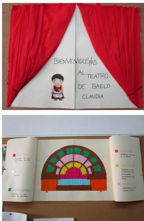
Fig 7. Recreación del teatro de Baelo Claudia.