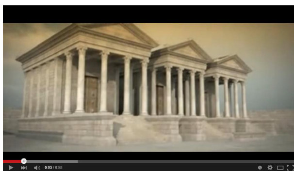
Templos del Capitolio 3d (Baelo Claudia). Virtual Capitol Temples

A continuación, proponemos una actividad manual que consistirá en levantar los templos dedicados a la Tríada Capitolina y el templo de Isis, con la finalidad de que puedan comparar las semejanzas y similitudes tanto de tamaño como de características de estos edificios religiosos. Para apoyarlos con el diseño libre de estos santuarios proyectaremos una reconstrucción de cómo eran originalmente.