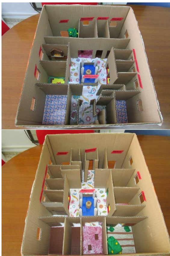
Fig. 4. Distribución interior de una vivienda doméstica romana.

En el taller dedicado al urbanismo deberán situar en el siguiente mapa las rutas territoriales que conectaban Corduba con la ciudad portuaria de Baelo . Proyectaremos en un powerpoint la siguiente imagen que servirá a modo de ejemplo para llevar a cabo la actividad.