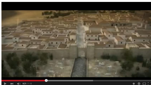
Baelo Claudia 3d, Ciudad Romana / Virtual Roman City

Cuando hayan respondido por grupos, visualizarán durante unos segundos un vídeo con una panorámica virtual de la ciudad de Baelo en 3D.