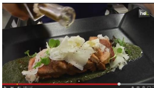
Fig. 6. Receta del Garum Gaditanum por investigadores de la UCA.

Ya que tenemos perfiladas las rutas comerciales, señalaremos en el mapa el puerto baelonense y la factoría de salazón. A continuación, trabajaremos el taller: ¡Un manjar: el Garum Gaditanum! . Para la ocasión invitaremos a un experto al aula que dará unas pautas para que elaboremos una succulenta receta y podamos invitar a nuestros compañeros de otras aulas. Como apoyo se visualizará una recreación de dicho manjar que les permitirá tener un referente para elaborar el garum a partir de las últimas investigaciones realizadas en la Universidad de Cádiz.