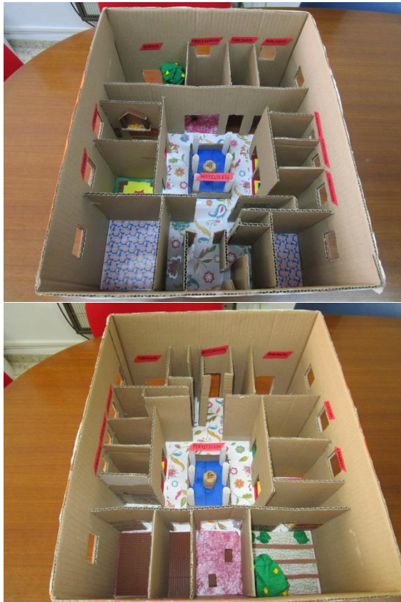
Fig. 4. Distribución interior de una vivienda doméstica romana.

En el taller dedicado al urbanismo deberán situar en el siguiente mapa las rutas territoriales que conectaban Corduba con la ciudad portuaria de Baelo . Proyectaremos en un powerpoint la siguiente imagen que servirá a modo de ejemplo para llevar a cabo la actividad.