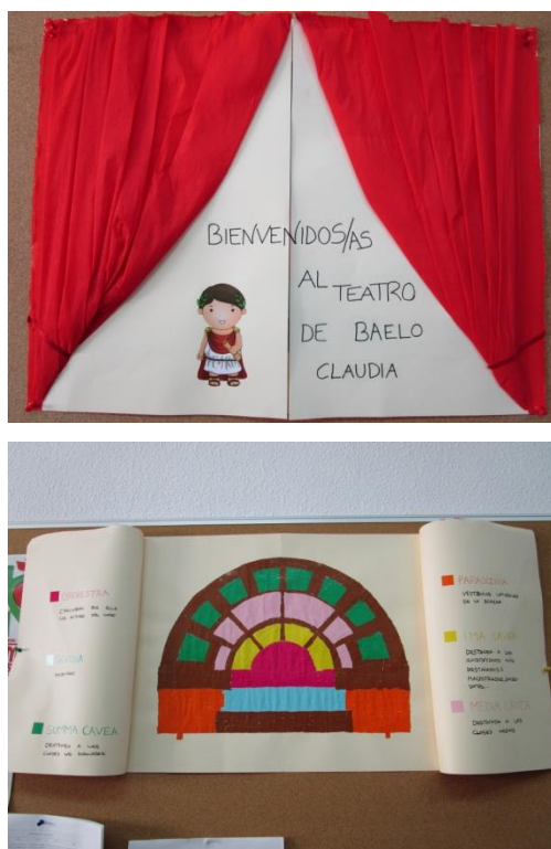
Fig 7. Recreación del teatro de Baelo Claudia.