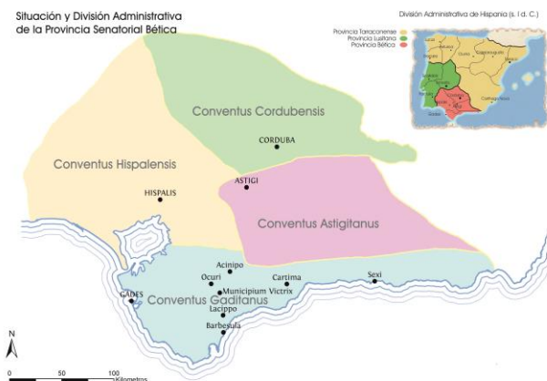
Fig. 5.

En el taller dedicado al urbanismo deberán situar en el siguiente mapa las rutas territoriales que conectaban Corduba con la ciudad portuaria de Baelo . Proyectaremos en un powerpoint la siguiente imagen que servirá a modo de ejemplo para llevar a cabo la actividad.